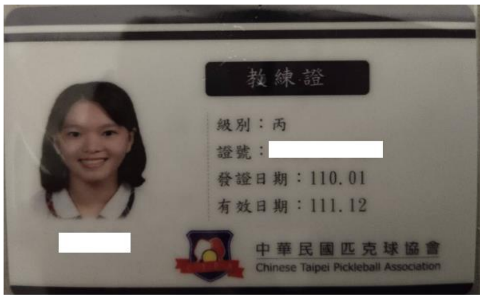
匹克球教練證丙級